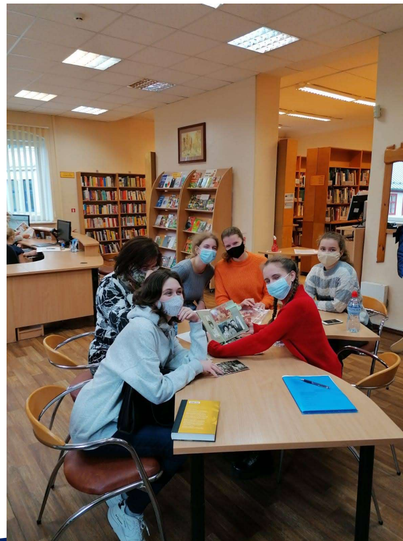
Foto: pasākums Liepājas Centrālajā zinātniskajā bibliotēkā (2020)